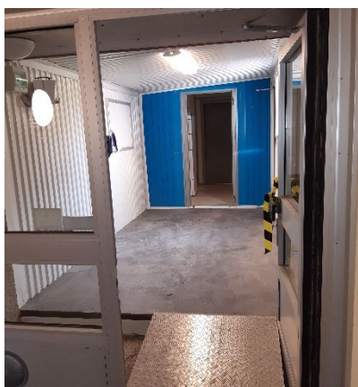
Från trapphus till hygienbod