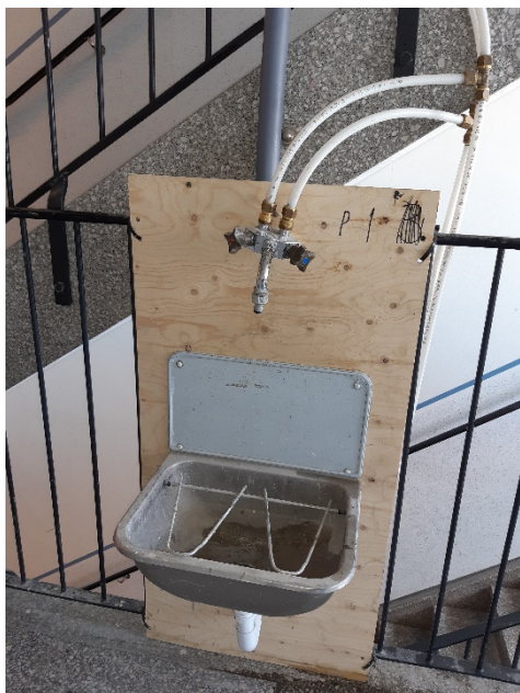
Tappställe med kallt och varmt vatten samt en utslagsvask.

När ditt badrum renoveras kommer vattnet till din lägenhet att vara avstängt. Detta innebär att du inte kommer ha vatten och avlopp i ditt kök. Du kommer istället få använda dig av de "tappställen" som sätts upp på varje våningsplan. Här finns kallt och varmt vatten samt en utslagsvask där du kan hälla ut vatten när du har diskat eller lagat mat.