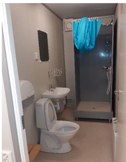
Insidan av hygienboden: toalett med dusch