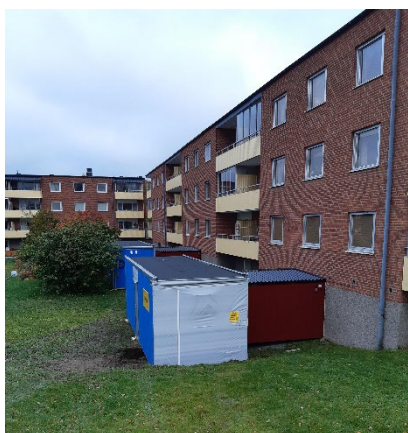
Utsida av hygienbod

Under renoveringstiden kommer du ha tillgång till toalett och dusch i den hygienbod som placeras utanför entrén mot innergården. Du når den utan att behöva gå utomhus. Det kommer att finnas en hygienbod per trapphus och varje hygienbod innehåller 4 toaletter med dusch, alla med låsbara dörrar.